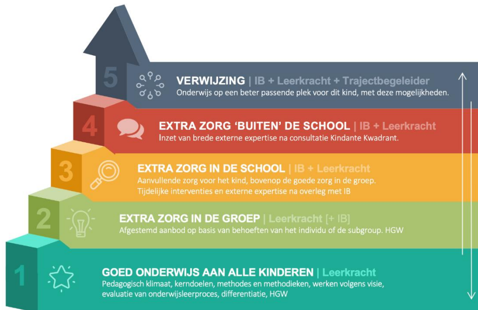
Figuur 1: Continuüm van Zorg

Basis van elke samenwerking binnen de school is het maken van goede samenwerkingsafspraken met externen over frequentie, tijdsduur en wijze waarop terugkoppeling naar school plaatsvindt. Via de volgende link meer info.